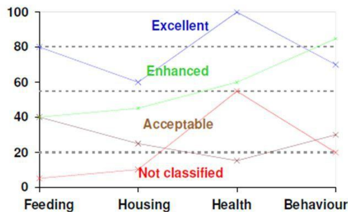
Gráfico 1. Criterios aplicados en la evaluación de los animales en granja y matadero.

Los criterios aplicados en la evaluación de los animales en granja y matadero son los establecidos por los protocolos Welfare Quality® o AWIN® según se resumen a continuación: